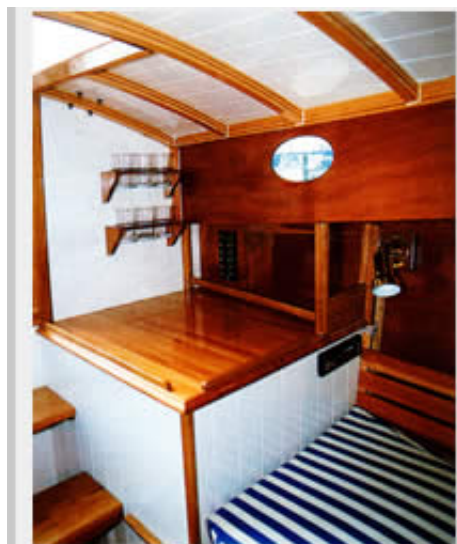
Alternativplatz für die Pantry: An Backbord ist ein großer Staukasten eingebaut

Ein Vorteil ist, dass jeder Bau eine Einzelanfertigung ist, die nach persönlichen Wünschen modifiziert werden kann. Da sollte man gleich bei den KJampen anfangen: Statt der etwas mickrigen Holz Ausführungen sind vorn und achtern je zwei größere Festmacherklampen - am besten aus Bronze - erforderlich.