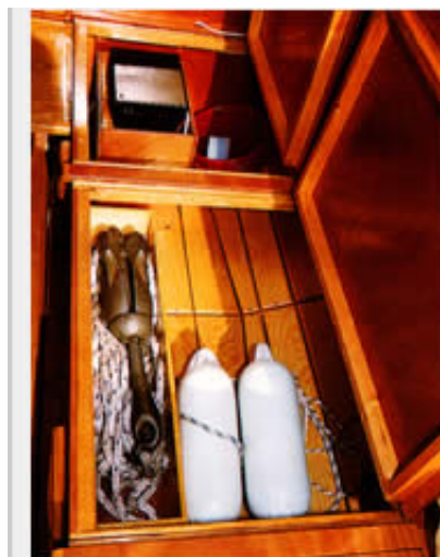
Saubere Holzarbeiten: Auch die übrigen Backskisten zeigen die Klasse der Werft

Mit einem Schrick in den Schoten geht dann die Post ab! Hier kommt das immerhin 23 Quadratmeter große Gaffelsegel richtig zum Tragen, und auch das fünf Quadratmeter messende Luggensegel des Besans zieht kräftig mit. Ohne Mühe erreicht das Boot in kräftigen Böen 5 bis 6 Knoten Fahrt. Mit Backstagswind und wellenunterstützt dürften es auch 7 Knoten werden. Bei starkem achterlichem Wind wird das Segeln - wie bei allen Cat-Booten - aufgrund des weit vorlich stehenden Großmastes und der damit verbundenen Gefahr des Unterschneidens leicht kritisch. Hier heißt es, rechtzeitig zu reffen.