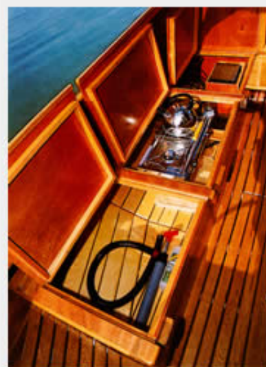
Freiluft-Pantry: Der zweiflämmige Kocher ist fest in einer Backskiste untergebracht

Um es vorweg zu nehmen: Es kostet einige Übung und Eingewöhnung, um das Boot in die gewünschte Richtung zu steuern, da das Rad nicht vor dem Rudergänger, sondern seitlich oder sogar achterlich von ihm liegt. Je nach Sitzposition muss man eventuell nach hinten greifen, und schwupp wird das Rad schon mal zur falschen Seite gedreht. Aber nach kurzer Segelzeit hat jeder den Bogen raus, und dann steuert's sich ganz kommod. Künftig soll das Niro-Rad mit einem Holz-Handlauf versehen werden, was wünschenswert ist.