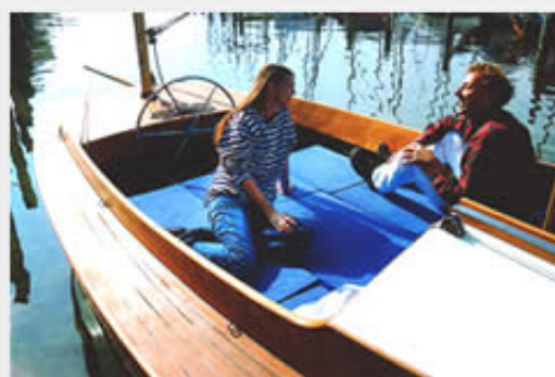
Plicht als Liegewiese: Hochgelegte Grätings und Einlegepolster schaffen eine bequeme Doppelkoje, die durch eine ohnehin empfehlenswerte Kuchenbude allwettertauglich wird