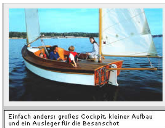
Einfach anders: großes Cockpit, kleiner Aufbau und ein Ausleger für die Besanshot

Das ist dem Thales-Team ohne Zweifel gelungen. Überall, wo das in Tschechien gebaute Sperrholzboot auftaucht, wird es neugierig bestaunt. Der ausgeprägte positive Deckssprung verleiht ihm ein schiffiges Aussehen, das Gaffelrigg tut ein Übriges. Selbst der kantige, im