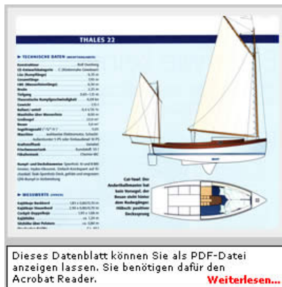
Dieses Datenblatt können Sie als PDF-Datei anzeigen lassen. Sie benötigen dafür den Acrobat Reader.